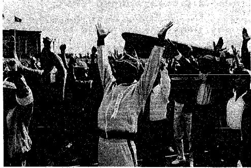
健康診査を受けていつまでもお元気で（昨年の老人スポーツ大会）