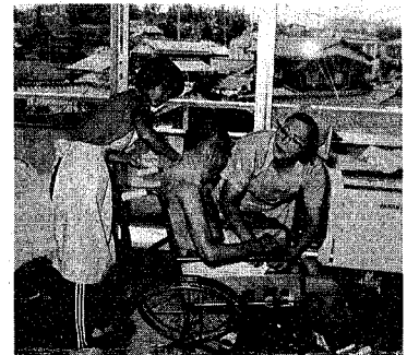
お年寄りの入浴介助（有明園）

特別養護老人ホーム「有明 園」では、お年寄りの入浴介 助をしたり、食事の世話をし ました。お年寄りの入浴介 助をしたり、食事の世話をし ました。お年寄りの入浴介 助をしたり、食事の世話をし ました。