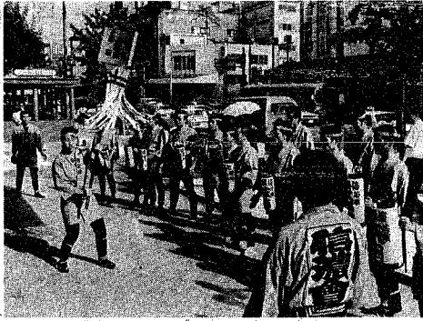
市役所前で女性会員がまじりを振りしました(敬愛の儀で)。