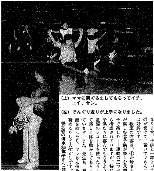
(上) ママに肩ぐるましてもらってイチ、ニ、サン。