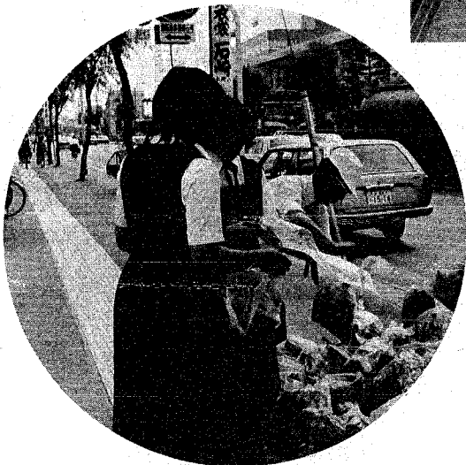
高 校生の参加もあって盛り上りを見せた道路清掃。集められたゴミの量に「意外に少ないわね」との声も。市民のマナーも向上か？

市では六月五日から十一日までの「環境週間」に、よりよい環境をもとめて、をスローガンに、道路清掃、環境パトロールなど多彩な行事を行いました。その中から、「よりよい環境は自らの手」と呼びかけながら実施した道路清掃、公害モニターの参加を得ての環境パトロールの様子を写真で紹介します。