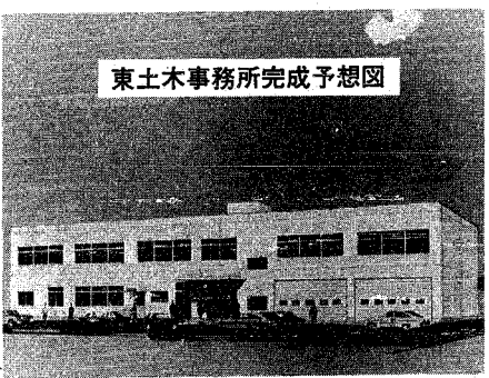
東土木事務所完成予想図

市の東土木事務所(明石通)が老朽化のため、市内松島町に新築移転することになり、今月から本體工事に着手しました。完成は、十月の予定。 新築できる建物は、鉄筋 敷地面積は千八百七平方メートル、コンクリート造り二階建てで、