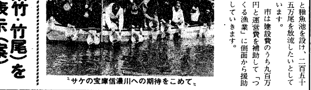
サケの宝庫信濃川への期待をこめて。

信濃川をサケの宝庫に 早く大きくなって戻つてこいよ。漁協関係者の大きな期待を背に、五月は北洋で回遊しながら、四五年には生まれ故郷の信濃川を目指し、戻つてくる。同漁協では、同組合のフ化場(自生産したものを、六十万尾を信濃川・五十嵐川両漁協の共同施設でフ化飼育されま