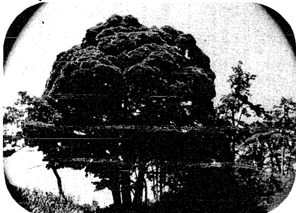
赤塚地区内の「たぶ」の保存樹

緑をふやし、環境の美化を図ることは、もちろん大切なことですが、同時に既存の樹木も、大切にしなければなりません。 新潟市では条例に基づく保存樹など(樹林も含む)の指定制度があります。どなたでも自由に観賞できる名木や巨木がありましたらご推せんください。 所有者からの指定申請があり、現地調査をして、条件を満たしている場合は、保存樹等として指定されることになります。 指定申請用紙は公園緑地課に用意してあります。