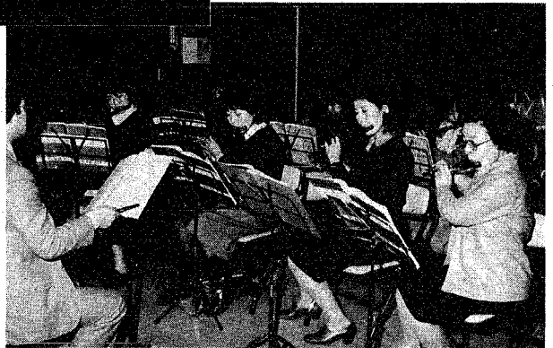
洋楽 銀の笛、 去年の7月から始めたばかりのフルートのグループ。初参加に張りきっています。