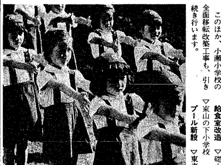
次代を担う子どもたちのための「青少年自然の森」の整備に着手します。

学校の増改築については、明日の新調を担う若者をつくるため、施設の整備も教育内容の充実を図りました。