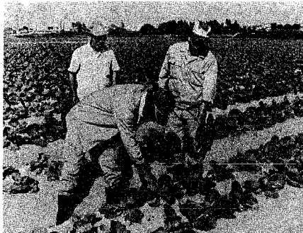
今冬はバカ高値のキャベツ。しかし、新潟市の農家が出荷する時は安値で泣かされました。

報告は、生産部会が①土地の問題、農地の地価が高くなり、より高収入を得られる地所に位置している。また、より高収入を得られる地所に位置している。また、より高収入を得られる地所に位置している。