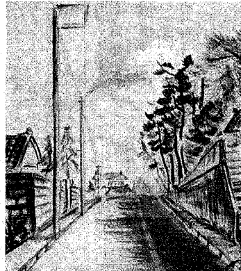
じゅんさい池公園への道

昭和四十八年から本格的に工事を始めた中部処理場は、必要な施設をほぼばきあがり、今年四月に試験運転に入り、七月からは万代だくため、市民相談室へおいでください。