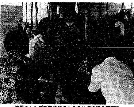
難民キャンプで診療にあたる全社協派遣の医師団

建設工事関係者の皆さんへ 建設工事を行う場合、作業の種類によっては、作業開始の七日前に作業実施の届出が必要で、この届出は、騒音規制法、振動規制法および新海市公害防止条例により定められており、適切な建設工事を行うために、工事関係者に義務づけられているものです。建設工事に伴うまわりの人の被害や苦情をなくするために、届出を行い指導を受けてください。