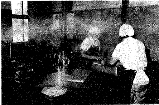
給食の食器も石けんで洗っています

市では、これまで学校や病院、福祉施設、市庁舎などで使用していた合成洗剤を新年度中に石けんに切り替える方針です。 昨年九月から「疑わしきものは使用せず」の方針で、一部の学校などで試験していましたが、合成洗剤使用中止は県内では新潟市が初めて。 市の施設において使用する一方、関係各課合同で「疑わしき洗剤について、いろいろ新潟の富栄養化防止条例を規制、また、八王子市では学校、保育園の職員が手のアレなど改善要求が出され、労務室で改定して促した粉石けんへの切り替えと