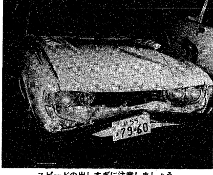
新潟市の交通事故発生件数（千六百六十六件）に比べ、千六百五十一件で前年よりわずかながらも十五件減りました。

新潟市の昨年一年間の交通事故発生状況がまとまりました。 それによりますと、件数、死者とも前年より減少しました。しかし、過去七年間減少しつづけていた傷者が十五件増えました。