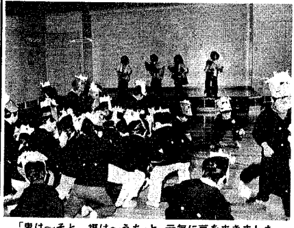
「鬼は〜そと、福は〜うち」と、元気に豆をまきました。