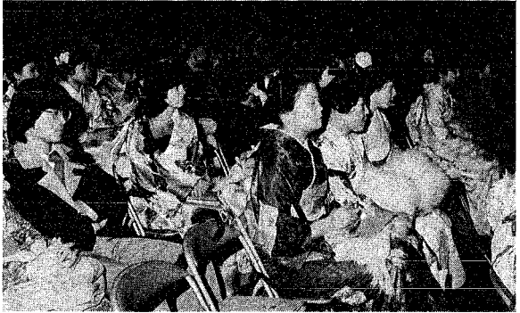
つとめに参加した3,500人の若人たち。先輩からの「祝いの言葉」をかみしめます。