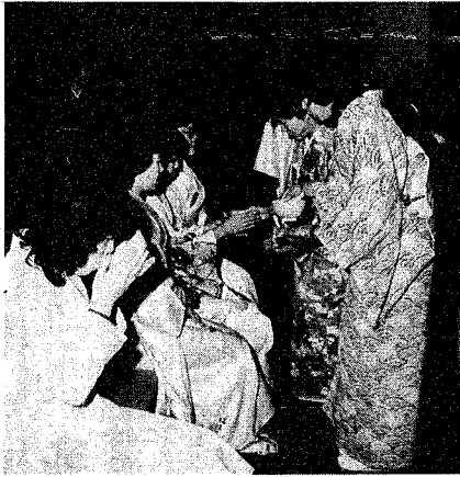
会場の一隅に設けられた茶席。400人もの若ものが抹茶のおおりと味を楽しんでいました。