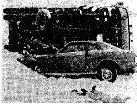
降雪時のスピードの出し過ぎによるスリップ事故

「冬の交通事故防止運動」冬期間における積雪、凍結などによる道路事情悪化、交通事故の多発が予想され、また、年末、年始にかけます。