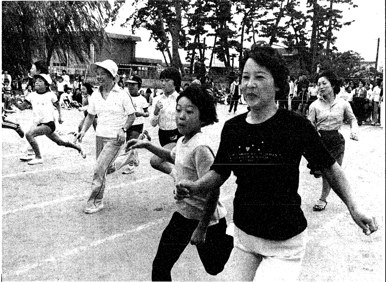
走るとは健康づくりのひとつです。(女池小親子運動会)