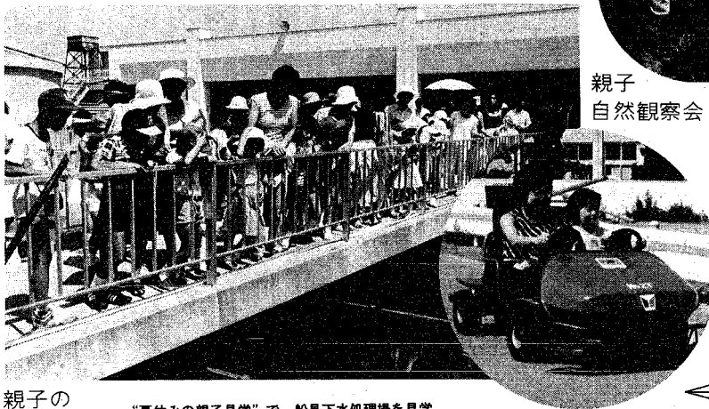
親子の市政バス “夏休みの親子見学”で、船見下水処理場を見学。

8月3日に行われた親子自然観察会。田上の種草堂山の植物を見て回り、名前や性質などを教わりました。