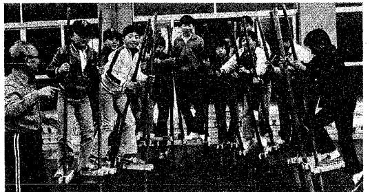
竹馬づくり——その③ 手づくりの竹馬にのった子どもたちの、この満足そうな顔、顔。竹馬づくりの指導にあたったおじいさんの掛声で、みんなそろって「はい！ポーズ!!」

「エへへ…。できたぞ、できたぞ、ここでさかきにしてトントンとたたいて。うまくできあがって思わずニコリ。