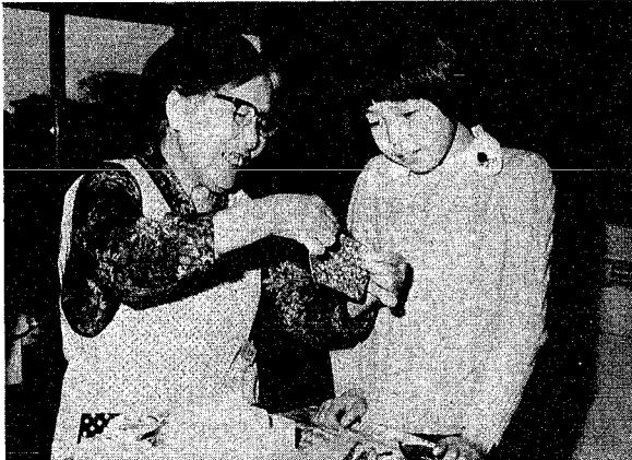
お手玉 本郷先生(?)に手ほどきをうけてお手玉作り。「昔はみんなこうして作ったものよ。お手玉遊びもうまいんだよ」と話もはずみます。