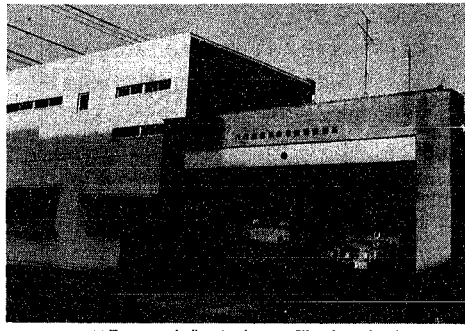
12月20日・完成したばかりの附船出張所

西消防署附船出張所の改築工事が終り、十二月二十日、竣工式が行われた。 附船出張所は木造平家建てで、改築されてからは鉄筋コンクリート造二階建てで、車庫のほか事務室、仮眠室などがあつた。敷地面積は約二百一十一坪、建築面積は延べ百八十七坪で、事業費は約二千五百八十万円、場所は今までと同じ附船町一丁目四百四十番地、受け持つている地域は附船町、入舟町、栄町など。約五千八十世帯、一万九千人余の安全を守っています。消防自動車二台も配備され、地域の防災に活躍が期待されています。