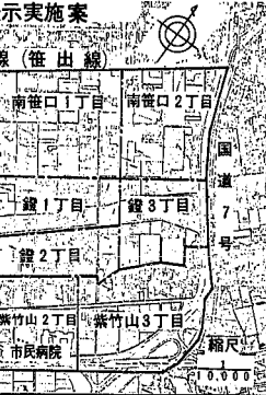
米山笹口地区住居表示実施案