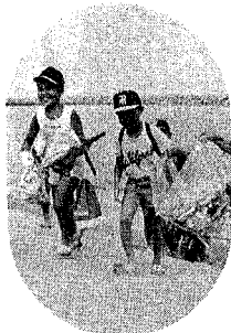
市民が自主的に「きれいなまちづくり運動」を展開