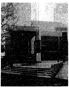
市民待望の音楽文化会館が完成