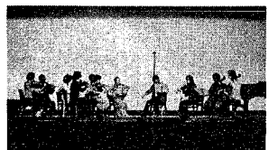
十一月二十六日、お母さんコーラスは二時開始だが、十二時半までに音楽文化館の第二練習室に集合する。昨年までは学校に集まり、発声練習から会場にかけつけたが、今年からはたくさん練習室があるので会場ができて本番。皆少し固くなって舞台上に整列する。私達のグルーブは七年前に誕生したが、本と音を思い出す。皆、コチコチ

うしの合奏で音がびびたり合ったときの気分は、何ともいえずうれしいものです。 年数のわりあいに、なかなか思うように上達せず、いつもぼやき合っています。この限り続けていきたい楽しいグルーブ、そしてすばらしい仲間たちです。