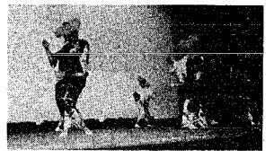
ちと一緒に踊ってみませんか。