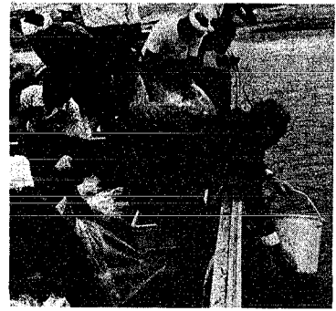
とる漁業、から育てる漁業、へ