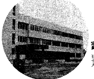
うぐいす色のモダンな中地区事務所 2・3階が公民館開館

いよいよ明日(二十九日)、新築なった山の下公民館がオープンします。今までは老朽化がひどく多勢集まつたたけり、ひよつと建てかゝるのではありませんが、もう大丈夫、は...と心配をおかけしていましたが、もう大丈夫、うぐいす色のモダンな鉄筋三階建てに生まれかわりました。