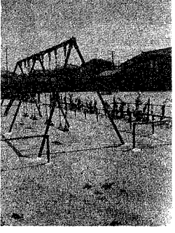
地元で管理しているボプラ公園

市では、地域の人の協力により、土地を借りて子どもたちのために、健康に安全に遊ぶことのできる施設を設置してきました。 このたび、土地所有者の協力を得て、さらに六か所を整備しました。 この子どもの遊び場(借)の承認が得られ、借地料は地公園設置事業は、設置 無償③設置する土地及び条件④土地の使用が五年の周辺が交通事故、自然災害等で、広さはおもむね二畝等の危険性がなく、自然芝百平方メートル以上の土地所有者の遊び場として適当である。