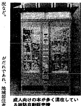
成人向けの本が多く混在している雑誌自動販売機