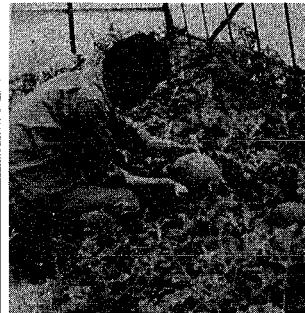
おいしそうな市産のハウススイカ

新潟では、明治の初めころから盛んに栽培されてい 病気の発生を防ぐため、カボチャやユウガオの台木に接木をしていきます。 三月下旬から四月中旬に、ハウスの中が、露地に定植