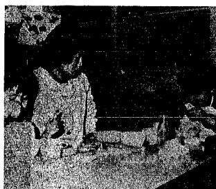
明生園幼児部での食事指導