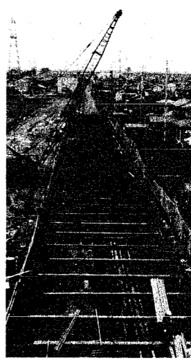
中部下水処理場への放流きよ建設