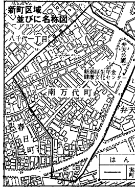
新町区域 並びに各標図

この運動は、歩行者、自転車利用者の事故防止を図るため、正しい交通ルールの実践を習慣づけることを目的としたものです。この期間中、新入学児に黄色の帽子を、新入園児には交通安全手帳を配布するほか、通学路に児童保護の看板を掲げ運転者の注意を促すなど、新入学(園)児