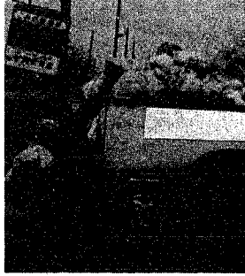
ごみはきちんと分別して出しましょう

「ごみの分別 分けられない廃プラスチック類」 雪がとけて目につくのは、分別収集を実施して東新潟可愛らしいものでは春を感じずる。日中、廊下で十分ガラス越しの日光にあて、夜間凍るような日は、部屋にとりこむようには。 葉がおちるのは、寒さより日光不足が多いようです。植えかえは五月ごろ赤玉土、腐葉土、砂二位の用土で植え直す。 雪がとけて目につくのは、分別収集を実施して東新潟可愛らしいものでは春を感じずる。日中、廊下で十分ガラス越しの日光にあて、夜間凍るような日は、部屋にとりこむようには。 葉がおちるのは、寒さより日光不足が多いようです。植えかえは五月ごろ赤玉土、腐葉土、砂二位の用土で植え直す。