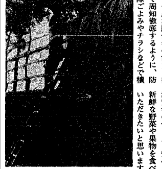
今年も実りが多いように...

「学校町 文芸小路」 その跡を語りゆくおもむきもよし、どこか大元の終り、のどかな時代であった。三人三様の文化人が住んだこの小路は、正に「文芸小路」ともいへるべき。