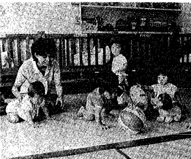
健全な成育は栄養から (宮浦乳児園)

市東西保健所では、今年も栄養教室を開催します。これは家族の健康をまず、健康、食品衛生などを学習 市東西保健所では、今年も栄養教室を開催します。これは家族の健康をまず、健康、食品衛生などを学習