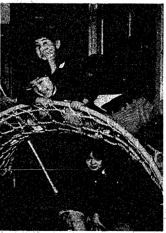
働く婦人にとって、たいせつな長時間保育

「問い」保育園の保育料が今年度から第二子以降半額徴収するということを知り、先般初めて知り、今年から先まで無料と喜んでおられました。今年から第二子以降半額徴収するということを知り、先般初めて知り、今年から先まで無料と喜んでおられました。 「問い」保育園の保育料が今年度から第二子以降半額徴収するということを知り、先般初めて知り、今年から先まで無料と喜んでおられました。