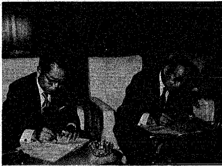
協定書に調印する波辺市長(右)と堀東北電力新潟支店長