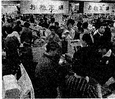
賑わう食料品売場

70年代は、ついでとも思 年息迎えますが、昨年来 の中東原油の影響で、経済事 情は厳しい情におかれています。 また、わたしたちの日常生活その影響を受け、物価の高騰、品不足、買ひあひの不安が 増えています。 このような情勢に処する為、県・県民の協力を得るに決しましたが、東も、昨年十月 二十一日、生活関連物資対策本部を設立し、市民の皆さんと共に対策を推 進していくことに決めました。 一方、市長が、新潟市長生活関連物資対策本部を設け、行政と一体となって策 に臨むことになりました。 また、対策本部、対策委員会のあつまり、幾多の困難を乗り越え、市民生活の安定を期すこととします。