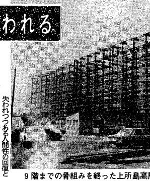
9階までの骨組みを終った上所島高層分譲住宅のA号棟

市長の手紙を出す疑問 はがきで五月十日までに市長の手紙を出す疑問。市長の手紙を出す疑問。市長の手紙を出す疑問。