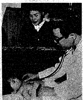
健康確保を図るため、乳児と妊産婦の医療費が無料になる。

妊産婦や乳児の医療費助成、二千四百人以下の世帯妊産婦... 制度は、妊産婦を妊娠の発覚より、出産後、乳児の生後1年まで... 医療費の無料化 乳児医療費を無料に⇔休日診療所を開設