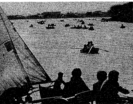
春から夏、秋へと若者は、ボートやヨットを湖に浮かべ青春を語る。