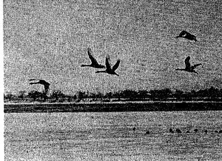
冬ともなると、白鳥など多くの水鳥が渡来し、遊ぶ。