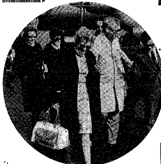
市に第1歩 新潟空港に着いた使節団一行。