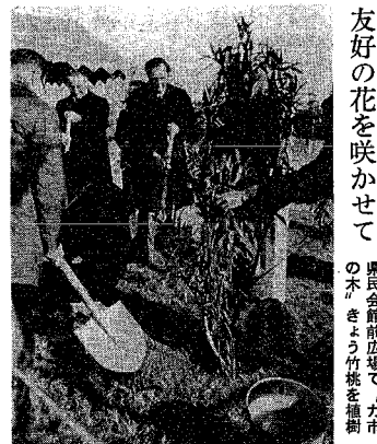
友好の花を咲かせて 県民会館前広場で、ガ方市の木きょう竹桃を植樹