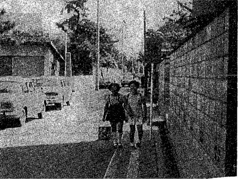
▲ 児童の通学路を指定し、安全施設や交通規制を設けて、その安全を図っている。