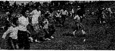
▲ 十月十日体育の日、県営上越球場に一千六百人を集めて行なわれたママさんの大運動会

福祉優先の市政の発展を促すこと を自らにスタートした1977年もあざむき日 終わろうとしている。 福祉政策は、独居老人の医療費無料化実施、 老人電話開通の実施など、老人福祉開大 きな前進を計り、来年1月からの七十歳以上の一般 老人全体を対象とした医療費の無料化実施へと夢 を継ぎました。また1月には広聴課を新設し、 市民の声を吸収する一方、市民相談室を充実さ せて、問題解決に力を入れたい。以下一年 間を振り返ってみたい。