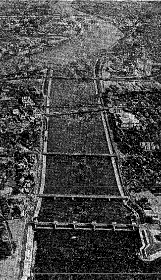
▲ 新潟市を洪水から守る開屋分水が8月10日に通水。西港の再開発をはじめ、今後のまちづくりにも大きな夢を託してくれた。