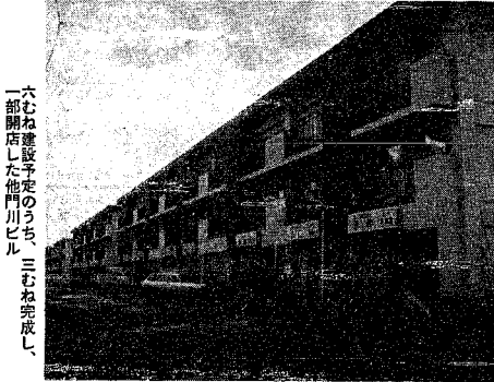
六むね建設予定のうち、三むね完成し一部開店した他門川ビル

日本海タワーで通年 ●参加店 市みやげ品協会員21社 ●内容 銘菓、漬物、民芸品など80点が展示されています。