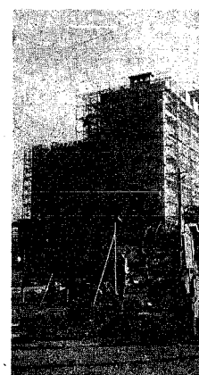
完成近い宮浦住宅

母子世帯 曾野木団地は、母子世帯が住みやすいよう、20平米の部屋を設けています。