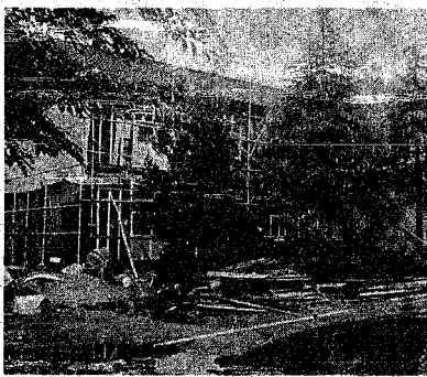
オープン目指し工事は急ピッチ