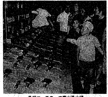
見学コースの一つ青山浄水場