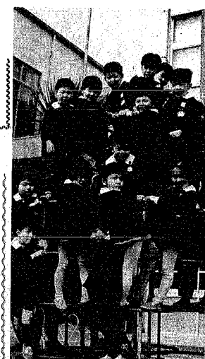
子供の将来も健康であればこそ……

さる28日で閉会した3月市議会に、市から提案された国民健康保険料の改訂が認められ、4月から保険料は平均64.91パーセント引き上げられることになりました。