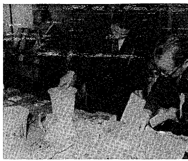
さすが新潟市のみやげ品/と真剣な審査員