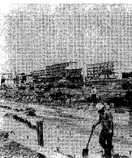
石山団地に次ぐマンモスベッドタウンとなる曾野木団地

建設費総額三億一千五百万(二億二千四百四十万)で、四・五割は、建築費、四割、雑費といわれています。