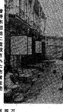
曾野木田地に建設された市営住宅

「住宅」は、市民の生活環境を向上させるための取り組みです。今回の「住宅」は、市民の憩いの場として整備される予定です。