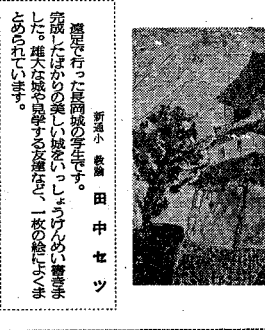
新潟小 兼巻 田中セツ 「築太はかの美しさを、しよんけんに書きまわして、母は坂を登る姿を、一夜の絵にうまうまにのびて」