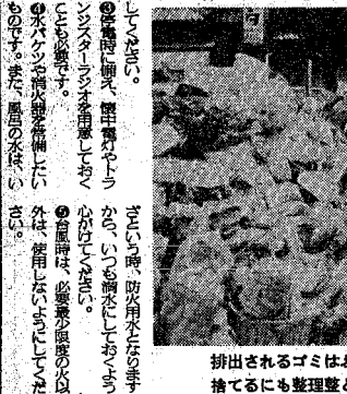
排出されるゴミはふえる一方。捨てるにも整理整頓が必要

この時期、火災が頻発する。大町では、この時期に、大町市消防団が、火災予防の啓蒙活動を行っている。この活動は、火災予防の啓蒙活動の一環として、大町市消防団が、火災予防の啓蒙活動を行っている。