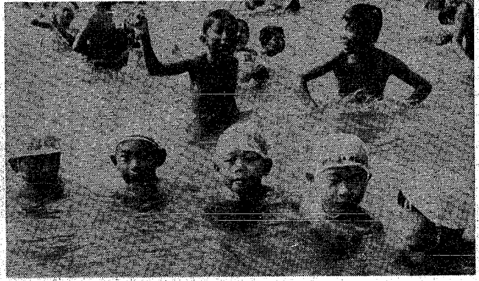
真黒に日焼けした顔、顔、顔……