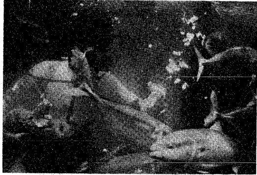
海女の餌づけは二十八日以降午前十一時 午後一時半、二時半の二回行なう。

新米産種はいよいよ五月 二十七日(金)から(土)まで にち魚の餌づけを開始す予定 で、魚の餌づけを準備すま す。