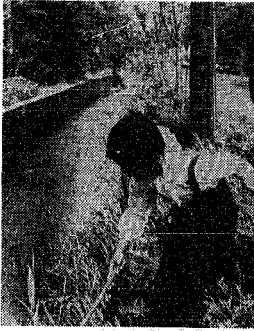
幼児の水死は親の不注意が原因

子どもを水から守ろう 「危険な水遊びを止めよう」 と、市警署は、幼児の水遊び を、厳しく注意す。水遊びは、 子どもにとって、危険な遊び である。水遊びをする時は、 必ず、大人がそばに付き、こ れを監視す。水遊びをする 時は、必ず、大人がそばに 付き、これを監視す。水遊び をする時は、必ず、大人が そばに付き、これを監視す。